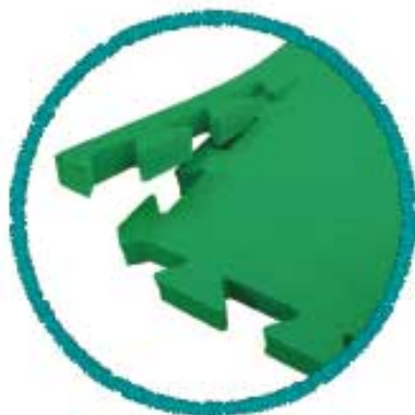
サイドパーツの拡大